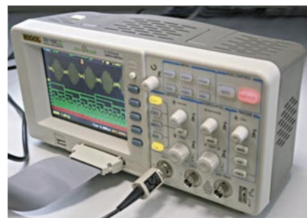
Рис. 1. Внешний вид осциллографа DS1102CD

Эргономика осциллографа также на высоте, и времени на освоение новой модели требуется совсем немно-