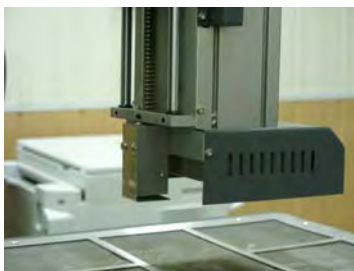
ИК-датчик на корпусе верхнего нагревателя Quick 2035

В комплексах Quick BGA в настоящее время ИК-датчик имеет два варианта расположения: в консоли стойки корпуса и на корпусе верхнего нагревателя (Quick 2035).