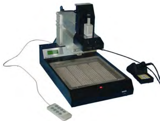
Quick IR2005+ (для наглядности без стола для фиксации печатных плат)