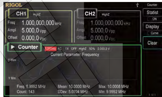
Функция статистического анализа у частотомера