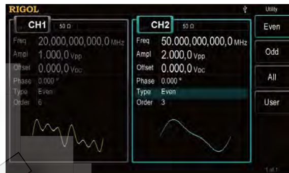
Настраиваемая функция генерации гармоник до 16 порядка