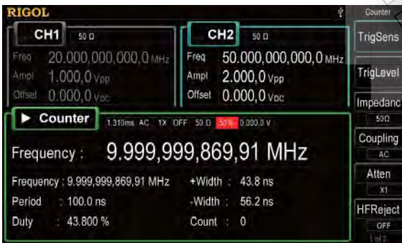
У всех моделей функция частотомера с высоким разрешением