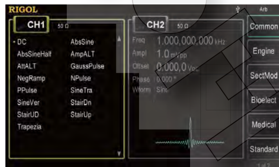
Функция генерации сигнала произвольной формы, до 150 встроенных форм сигнала