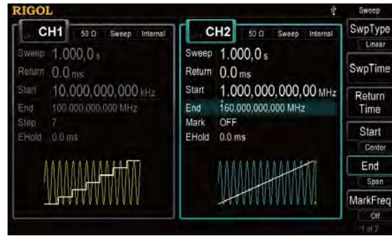
Различные режимы свип-генератора