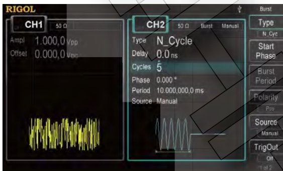
Режимы генерации шума и пачки